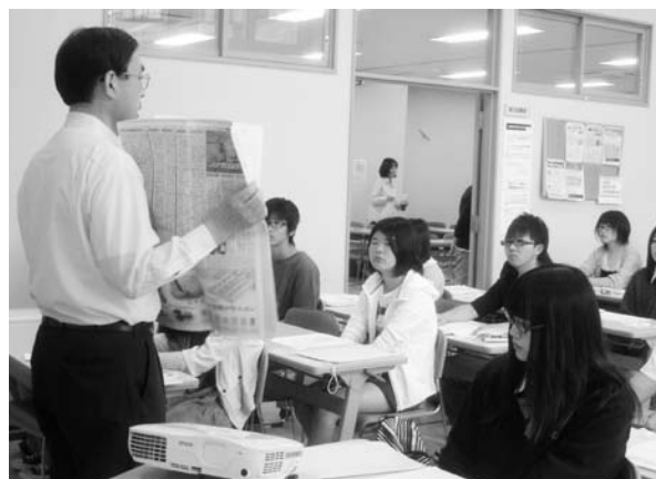
▲河北新報社の協力による「新聞の読み方講座」

そして、このような夏ボラの準備の様子から実際の体験の報告などを、河北新報社が運営する地域SNSサイト「ふらっと」内の「夏ボラ