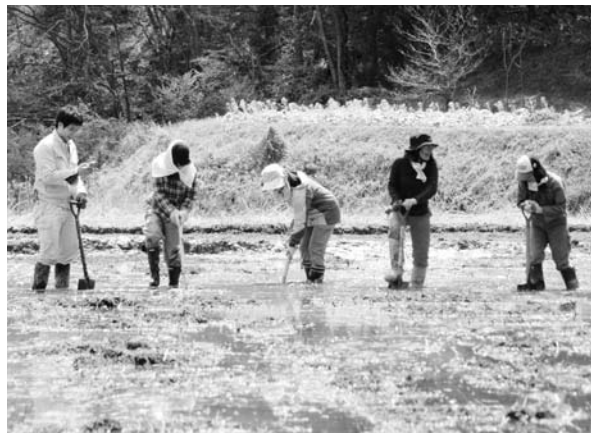
▲今年5月、南三陸町秋目川地区の水田への水入れを行いました

大崎市に事務所を構える「田んぼ」は震災の発生直後、沿岸被災地で物資支援を始めとする様々な支援を行いつつ、四月下旬からは団体の専門である水田の復元を復興活動の中心に据えました。