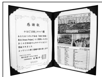
▲ベガルタ仙台から贈られた感謝状