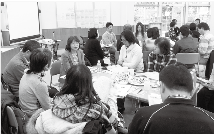
▶ゲストを囲んでの質問タイム

そして「社会で何かアクションすることは、人と出会い繋がるということ。それは自分自身の生きがいにもなる。NPOにとってボランティアが多いほど、支援を必要とする多くの人に手を差し伸べられることなので、今日のこの出会いに期待し、一人でも多くの方がボランティアに参加することを期待しています」と続けました。これからも、みやぎNPOプラザは皆さんの新たなチャレンジを応援します!